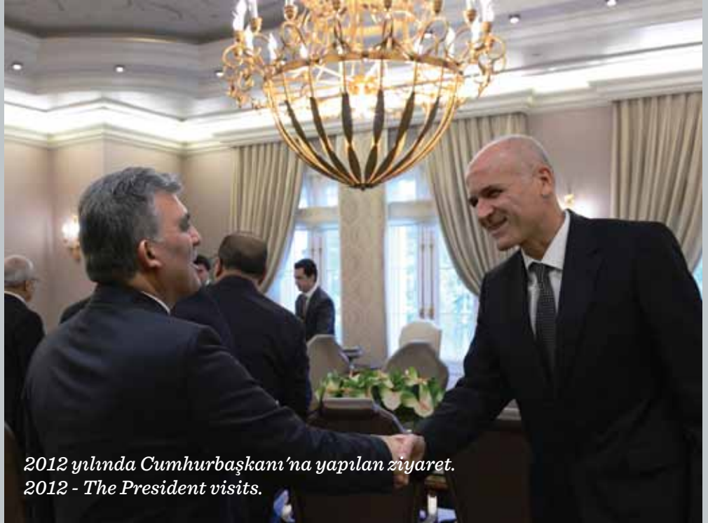
2012 yılında Cumhurbaşkanı'na yapılan ziyaret. 2012 - The President visits.

■ Under the UNDP, Coca-Cola and Habitat project "+ to Life", he trained four thousand students in Tarsus on sexual health through once-a-week conferences, and received recognition and an award for this project in 2005. ■ In collaboration with the Endocrinology and Family Medicine Departments of Çukurova University and the Tarsus City Council, he completed height, weight and waist measurements of 500 students in 12 schools in Tarsus in an effort to map school-age obesity, leading to a so-called 'Obesity Map' of the city. ■ He hosted over 250 TV programs on Monday evenings on the local Güney TV channel for ten years to inform the community on all things health related. ■ He is the columnist of an article on Yeni Mersin newspaper on health training. ■ In 2006, Cerrahoğlu was awarded "Doctor of the Year" by the prime minister of that time for his initiatives and projects on public health. In 1996 he received the "Kentucky Colonel" award and in