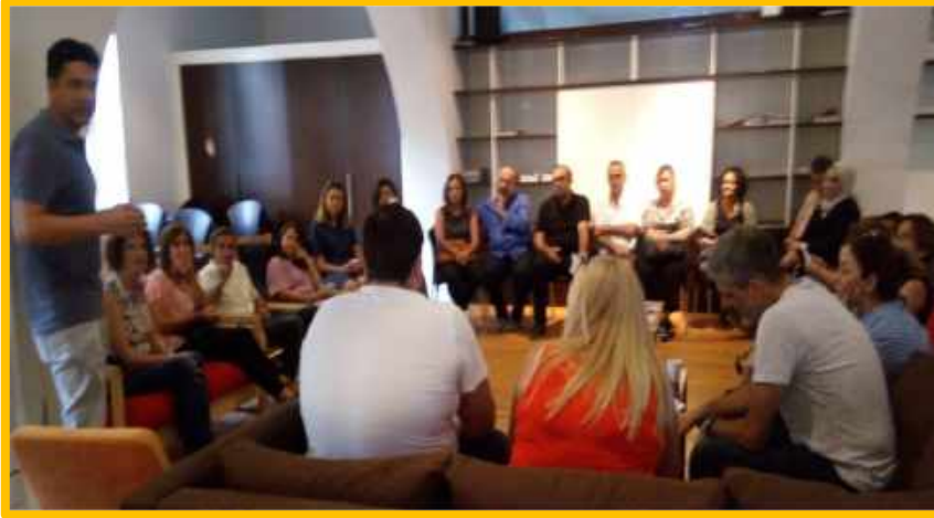
2019-2020 Veli Etkileşim Gruplarından Kareler