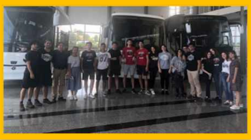
TEMSA Fabrikası Gezisi

PDR Servisi'nin meslek tanıtımı ve kariyer gelişimi konusunda yaptığı diğer bir çalışma işyeri gezileridir. Konferanslar, kariyer günü, üniversite gezileri ile öğrencilere sağlanan bilgilendirmeye ek olarak işyeri gezilerinde öğrencilerin pratik olarak üretim süreçlerini yakından gözlemlenmeleri, bir işyerinde bulunan bölümler ve yürüttükleri çalışmalarla ilgili bilgi almaları hedeflenir.