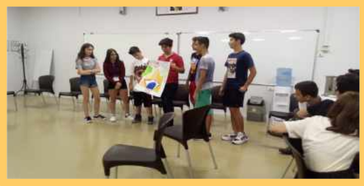
2019-2020 Dönem Başı Yatılı Oryantasyonundan bir kare

Okul yaşamında öğrencilerin akademik yönden başarılı olabilmeleri için, yatakhane ve etüt saatlerini iyi değerlendirmeleri önemlidir. Bu nedenle yapılan görüşmelerde, öğrenci bu yönde motive edilir. Ayrıca sağlıklı bir çalışma ortamının yaratılması konusunda, okul idaresi ile işbirliği içinde çalışılır.