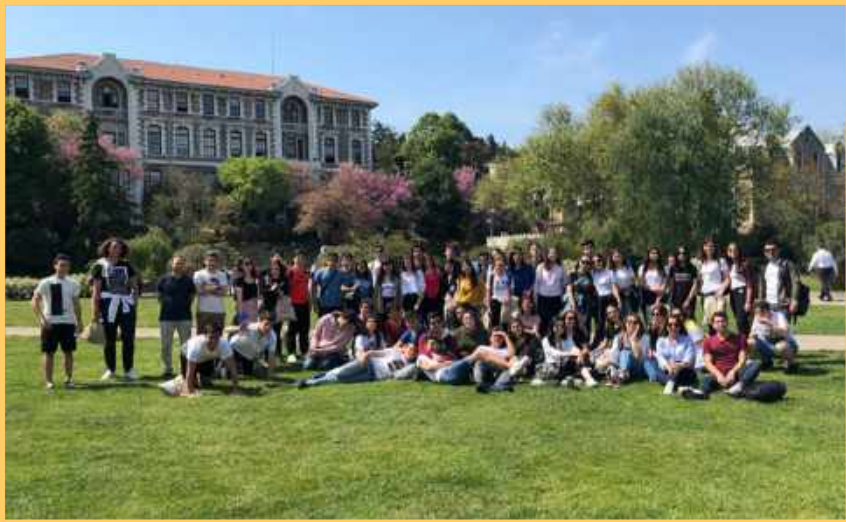
10. Sınıflar İstanbul Üniversite Gezisi