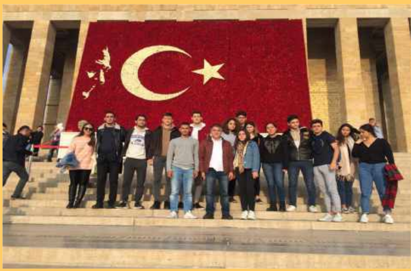
11. Sınıflar Ankara Üniversite Gezisi