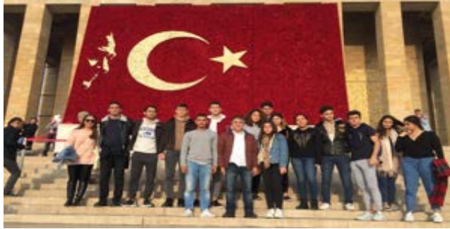
11. Sınıflar Ankara Üniversitesi Gezisi