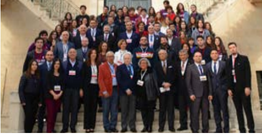
10.12.2019 Tarihli Kariyer Günü Konukları