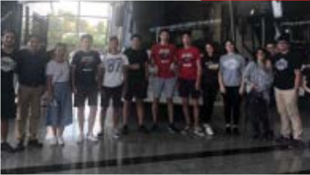
TEMSA Fabrikası Gezisi