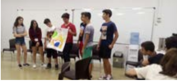
2019-2020 Dönem Başı Yatılı Oryantasyonundan Bir Kare

Ergenlik döneminde ailelerinden ayrılarak, bir yatakhane ortamında yaşamaya başlayan yatılı öğrencilerimizin, yeni sürece uyum sağlayabilmeleri konusunda sorumlu psikolojik danışmanlarımız tarafından, duygusal ve sosyal destek verilir.