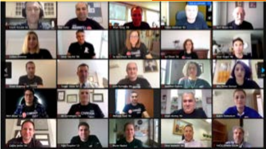
20.04.2021 Tarihli Çevrim İçi Kariyer Günü Konukları