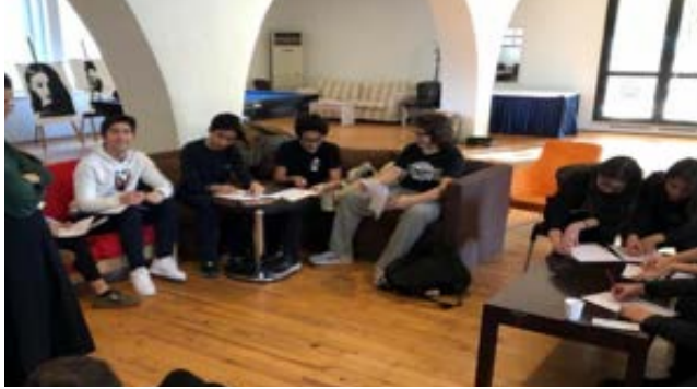
2019-2020Akran Rehberlerimizin Yatılı Hazırlık Sınıfı Öğrencilerimizle Gerçekleştirdiği Etkileşim Toplantısından Bir Kare