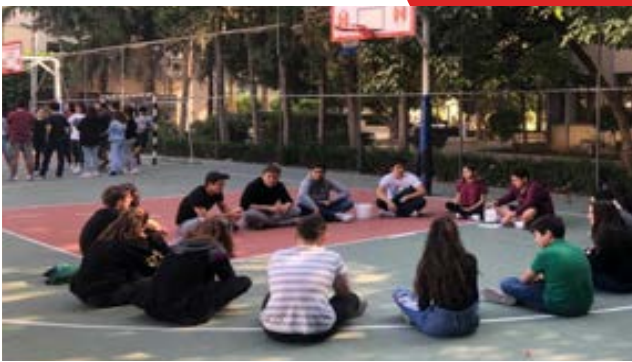
2019-2020 Yeni Hazırlık Sınıfı Öğrencileriyle Akran Rehberlerimizin Gerçekleştirdiği Oryantasyon Çalışmasından Kareler