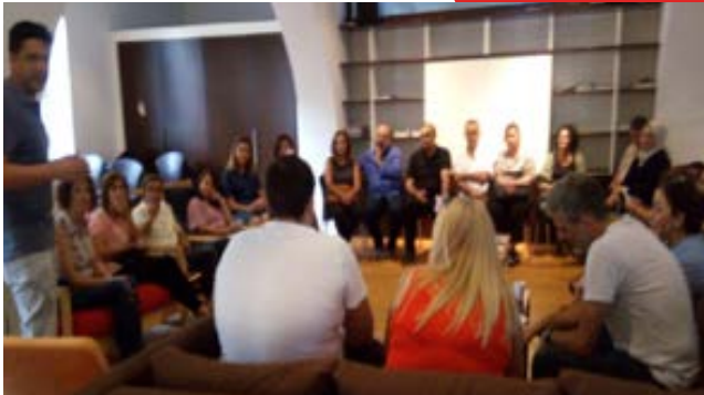
2019-2020 Veli Etkileşim Gruplarından Kareler