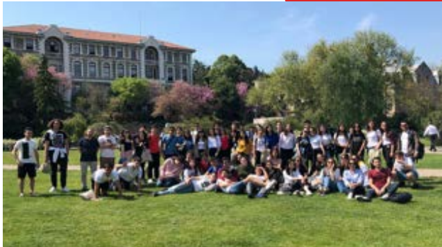
10. Sınıflar İstanbul Üniversitesi Gezisi