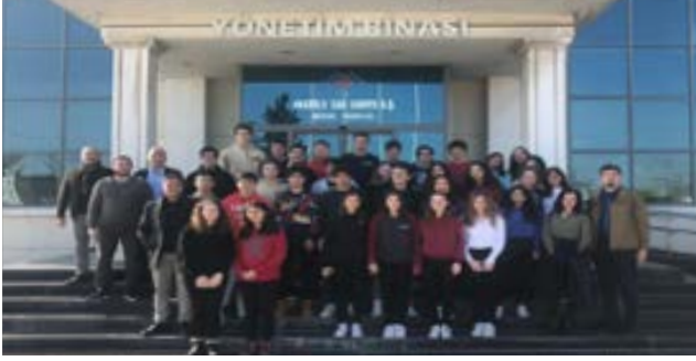
14.01.2020 Tarihindeki Şişecam-Anadolu Cam Fabrikası Gezisi

PDR Servisi'nin meslek tanıtımı ve kariyer gelişimi konusunda yaptığı diğer bir çalışma işyeri gezileridir. Konferanslar, kariyer günü, üniversite gezileri ile öğrencilere sağlanan bilgilendirmeye ek olarak işyeri gezilerinde öğrencilerin pratik olarak üretim süreçlerini yakından gözlemlemeleri, bir işyerinde bulunan bölümler ve yürüttükleri çalışmalarla ilgili bilgi almaları hedeflenir.