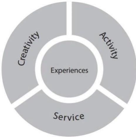
Şekil 1 - CAS deneyimleri

Bir CAS deneyimi, öğrencinin üç CAS bileşeninden bir veya daha fazlasıyla meşgul olduğu belirli bir olaydır.